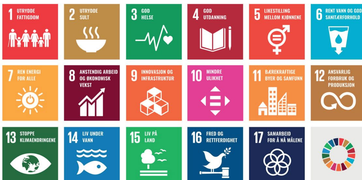
Figur 0-1: De 17 bærekraftsmålene.

2030-agendaen er FNs handlingsplan for bærekraftig utvikling, og denne er konkretisert gjennom 17 bærekraftsmål og 169 delmål, som ble vedtatt på FNs generalforsamling i 2015. Bærekraftsmålene har tre dimensjoner der bærekraftsmål 6, 13, 14 og 15 tilhører den miljømessige dimensjonen, 1, 2, 3, 4, 5, 7, 11 og 16 gjelder den sosiale og 8, 9, 10 og 12 gjelder den økonomiske. Bærekraftsmål 17 Samarbeid for å nå målene gjelder alle tre. Regjeringen Solberg avga Stortingsmelding 40 (2020-2021) – Mål med mening 1 i juni 2021. Stortingsmeldingen er Norges handlingsplan for å nå bærekraftsmålene innen 2030, og setter bærekraftsmålene inn i en norsk kontekst.