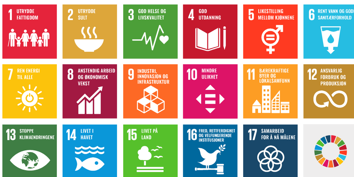
Figur 0-1: FN's 17 bærekraftsmål.

Deretter følger et delkapittel med vurdering av planenes bidrag til bærekraftsmålet. Dette er oppsummert i en tabell.