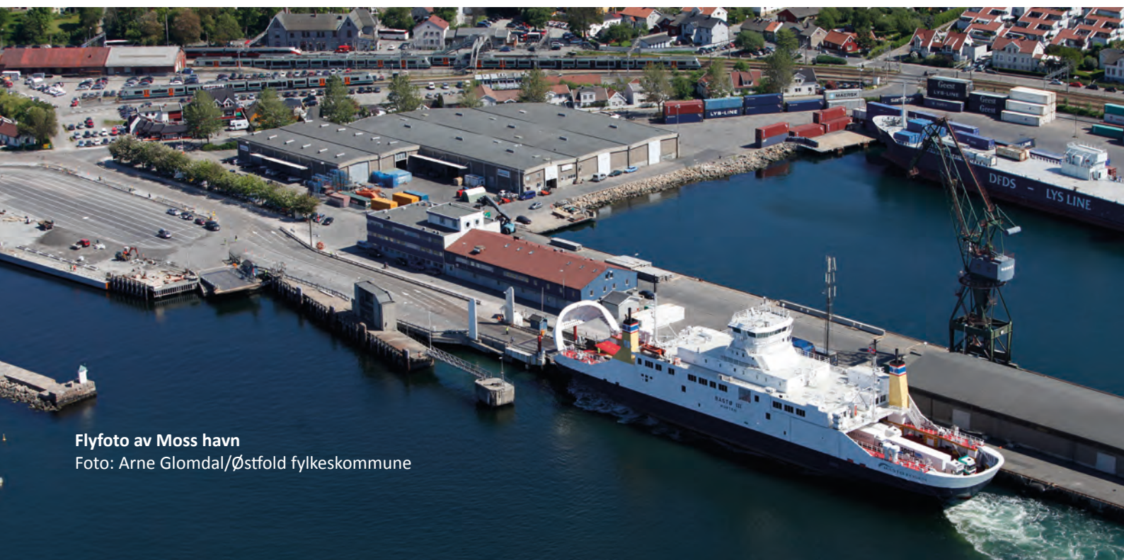
Flyfoto av Moss havn