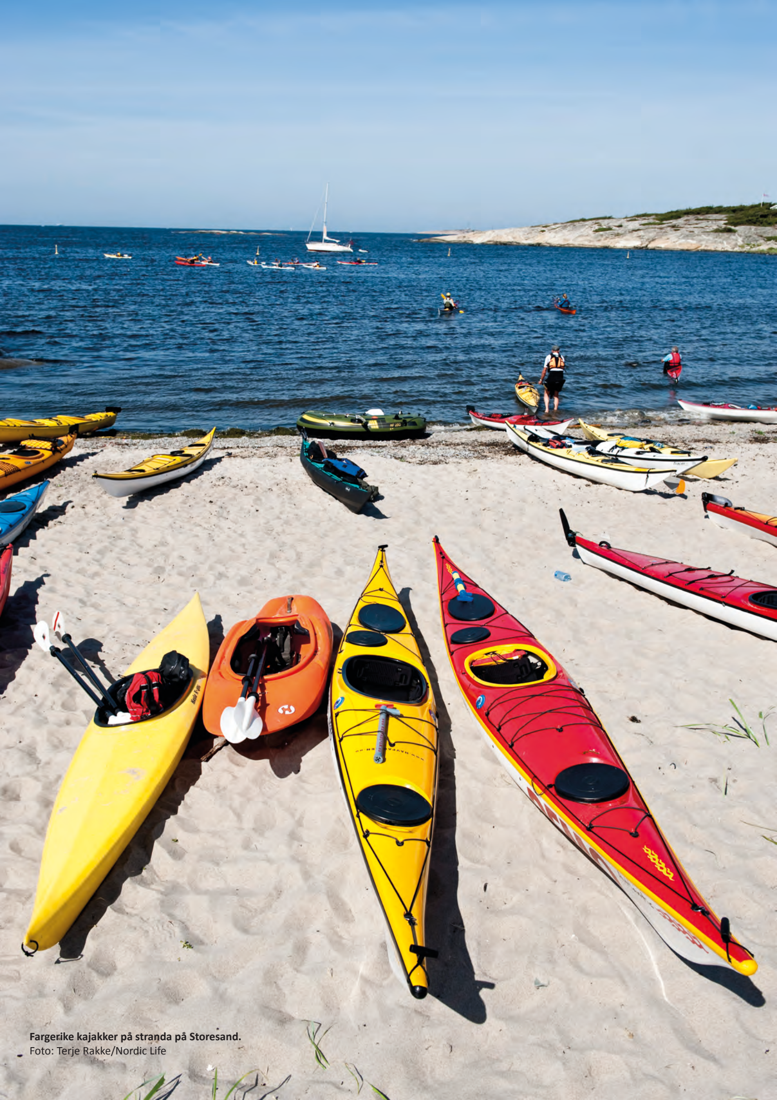
Fargerike kajaker på stranda på Storesand.