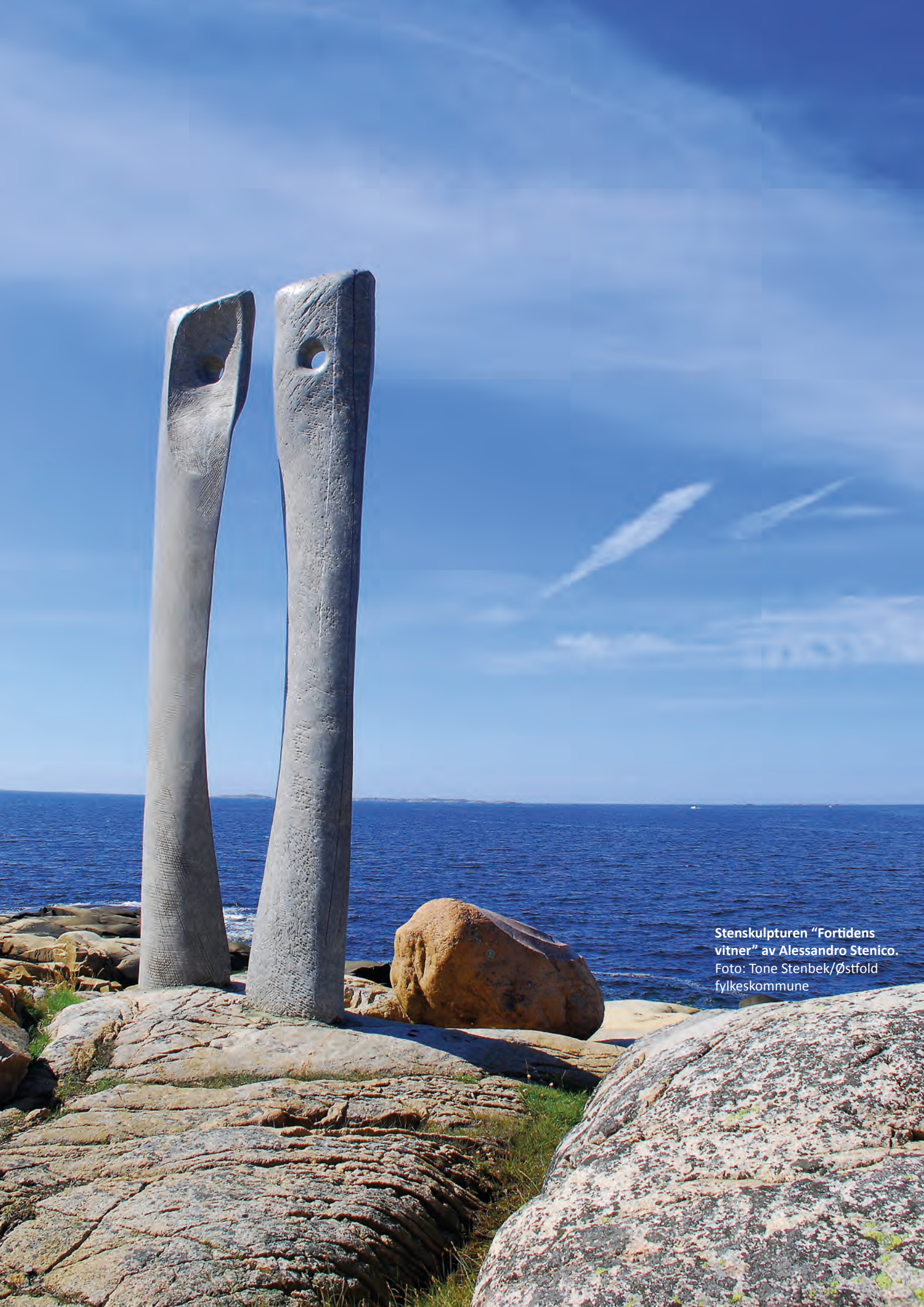
Stensulpturen "Fortidens vitner" av Alessandro Stenico.