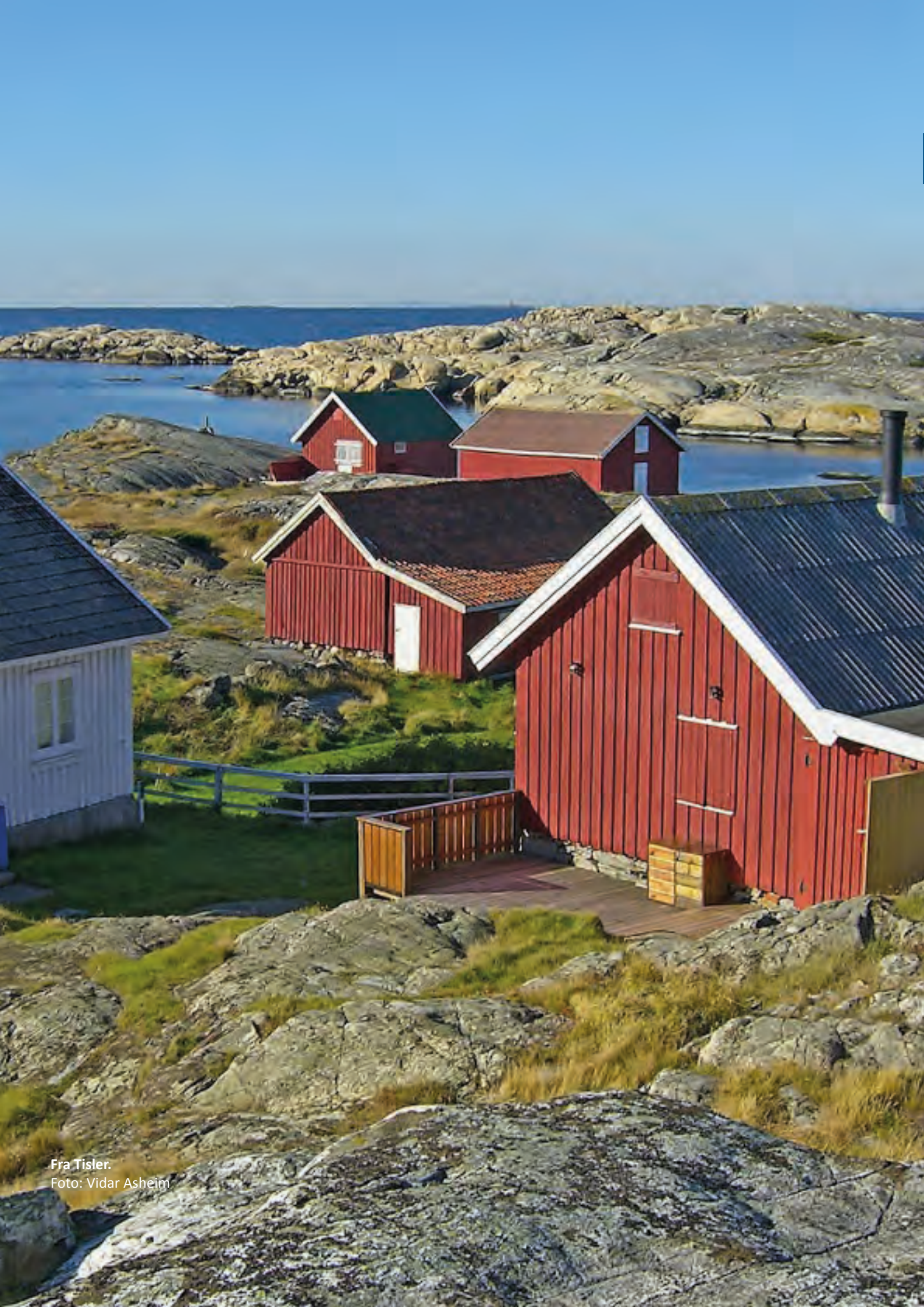
Fra Tisler.