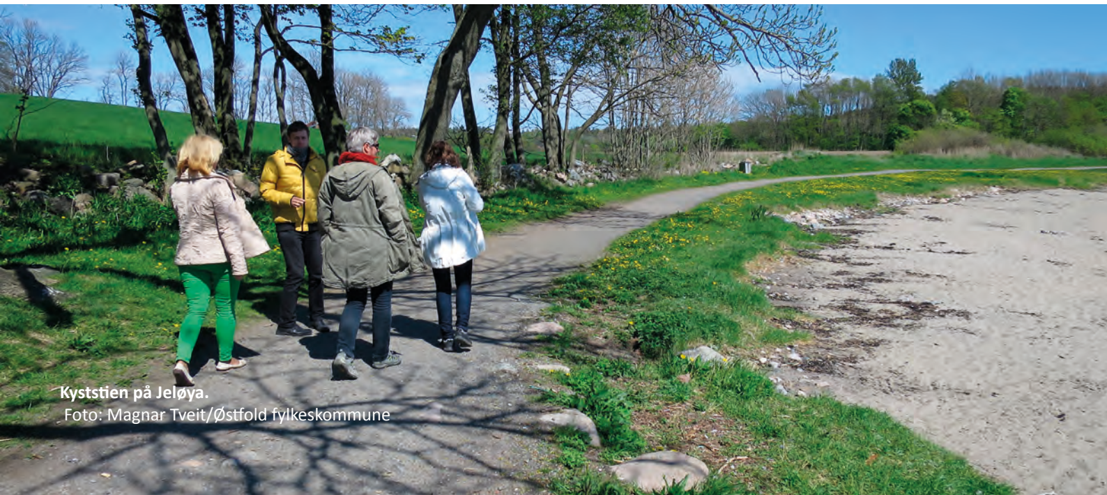
Kyststien på Jeløya.